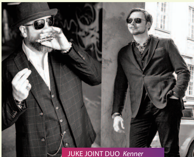
JUKE JOINT DUO Kenner lieben Blues oder Rock // 12.07.