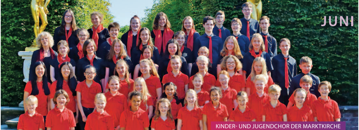
KINDER- UND JUGENDCHOR DER MARKTKIRCHE Himmel und Erde // 17.06.