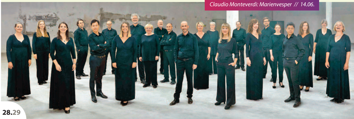
NDR VOKALENSEMBLE Claudio Monteverdi: Marienvesper // 14.06.