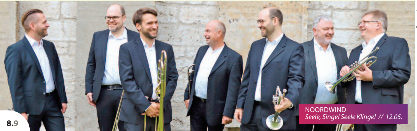
NOORDWIND Seele, Singe! Seele Klinge! // 12.05.