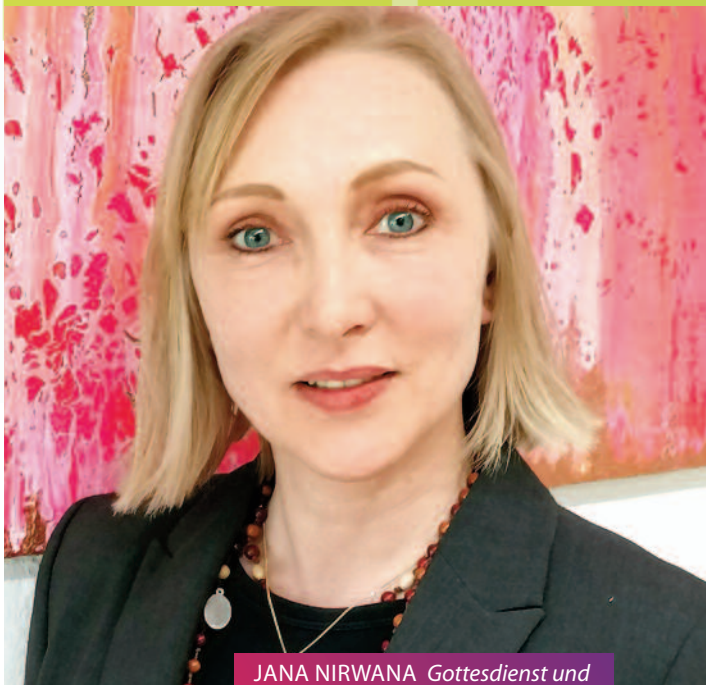
JANA NIRWANA Gottesdienst und Vernissage zur Ausstellung // 02.07.