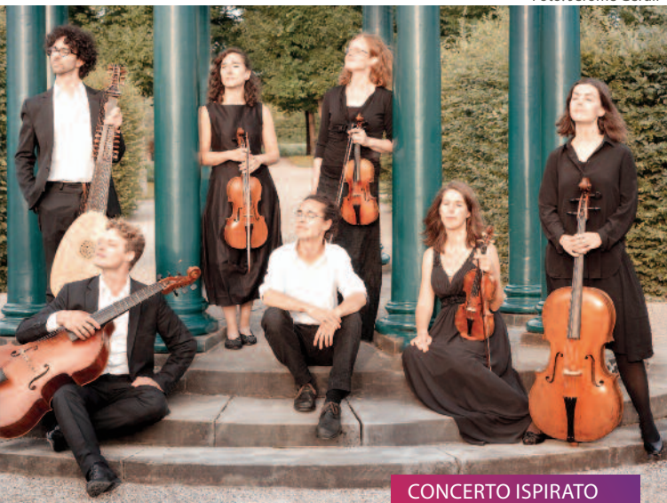
CONCERTO ISPIRATO Orlando Furioso // 02.06.