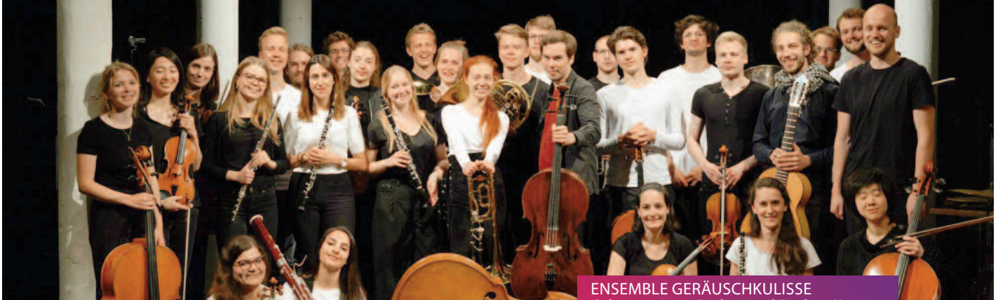
ENSEMBLE GERÄUSCHKULISSE Odyssee – Vom Suchen und Finden // 12.05.