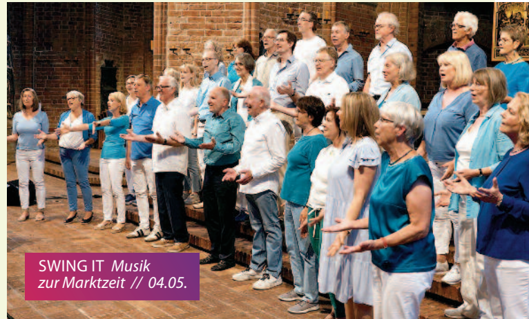
SWING IT Musik zur Marktzeit // 04.05.