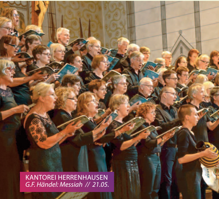
KANTOREI HERRENHAUSEN G.F. Händel: Messiah // 21.05.