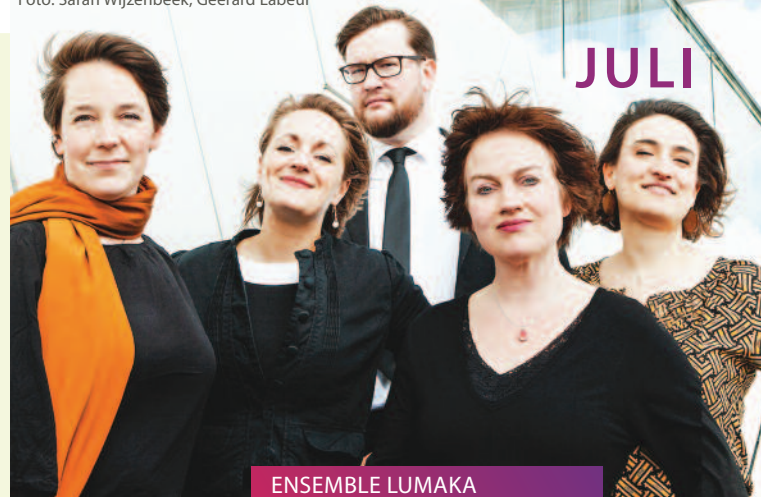
ENSEMBLE LUMAKA Traum und Sommerfest // 13.07.