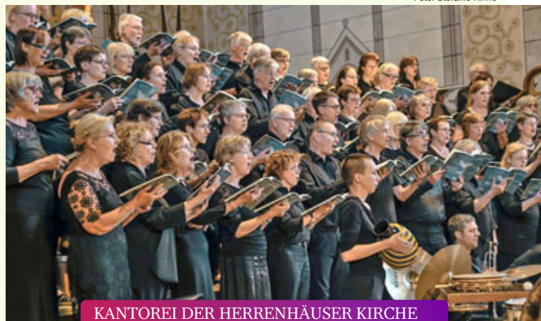
KANTOREI DER HERRENHÄUSER KIRCHE J.S. Bach: Weihnachtsoratorium I – III // 10.12.