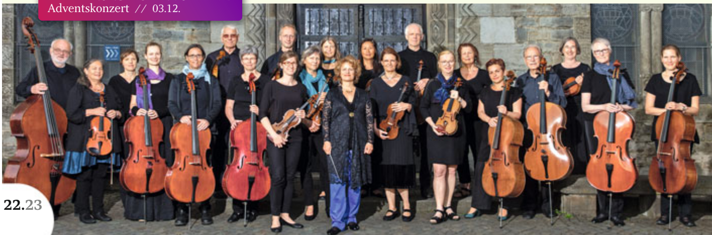
KAMMERORCHESTER BOTHFELD Adventskonzert // 03.12.