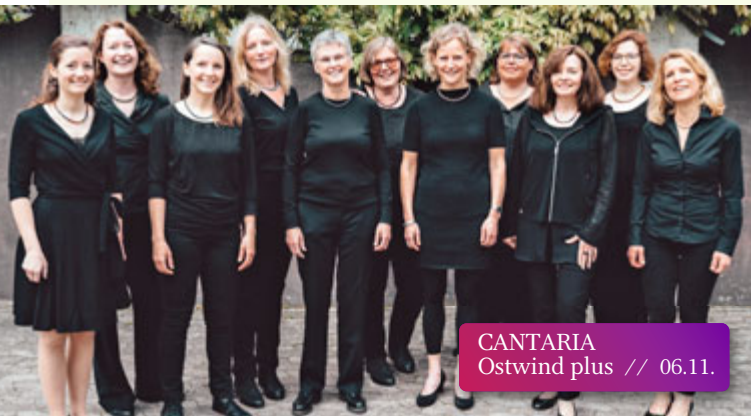
CANTARIA Ostwind plus // 06.11.