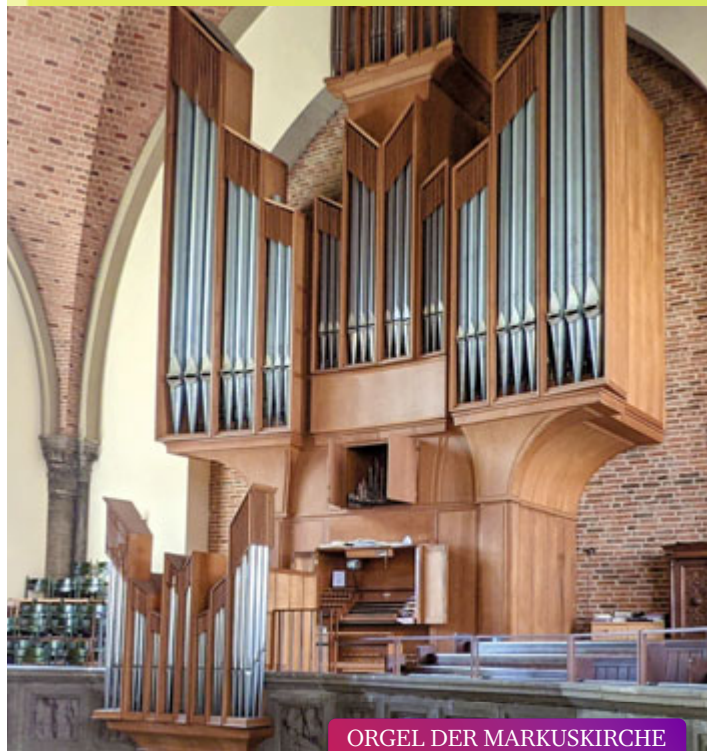
ORGEL DER MARKUSKIRCHE orgel:impuls // 02.11.