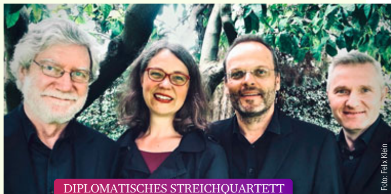
DIPLOMATISCHES STREICHQUARTETT Die Arbeit der Engel // 09.11.