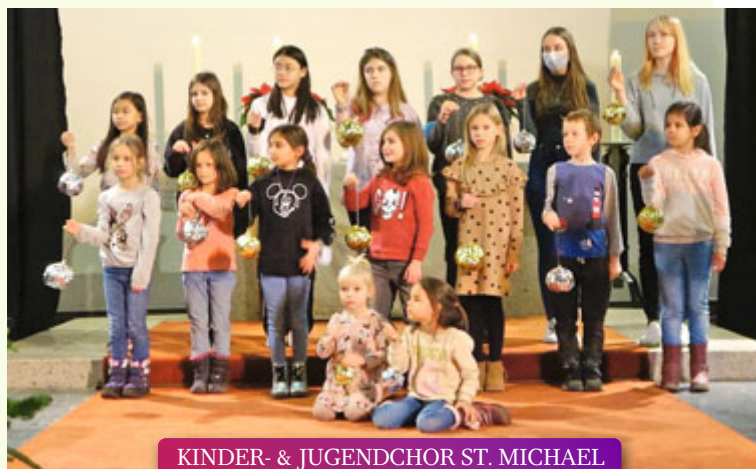
KINDER- & JUGENDCHOR ST. MICHAEL Der glückliche Stern // 24.12.