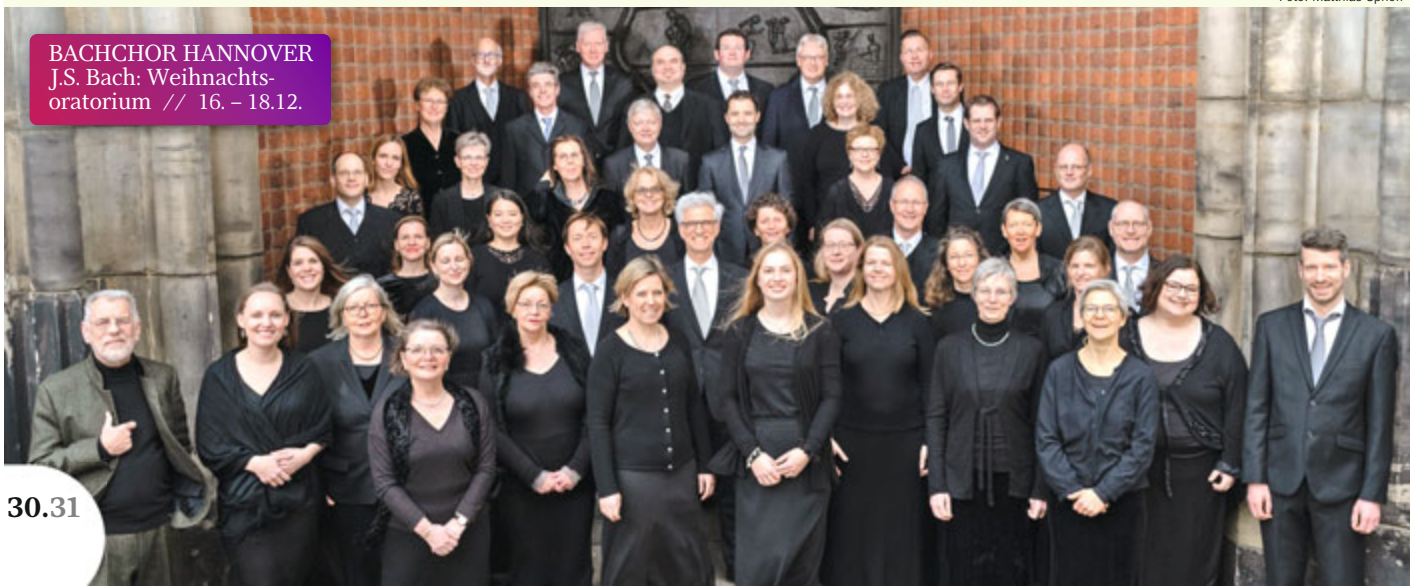
BACHCHOR HANNOVER J.S. Bach: Weihnachts- oratorium // 16. – 18.12.