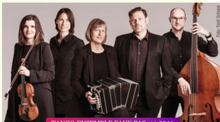
TANGO-ENSEMBLE FAUX PAS // 25.11.