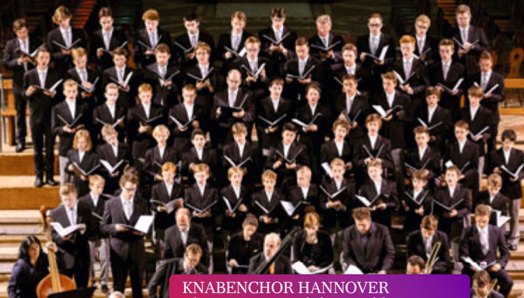
KNABENCHOR HANNOVER Christmas around the World // 11.12.