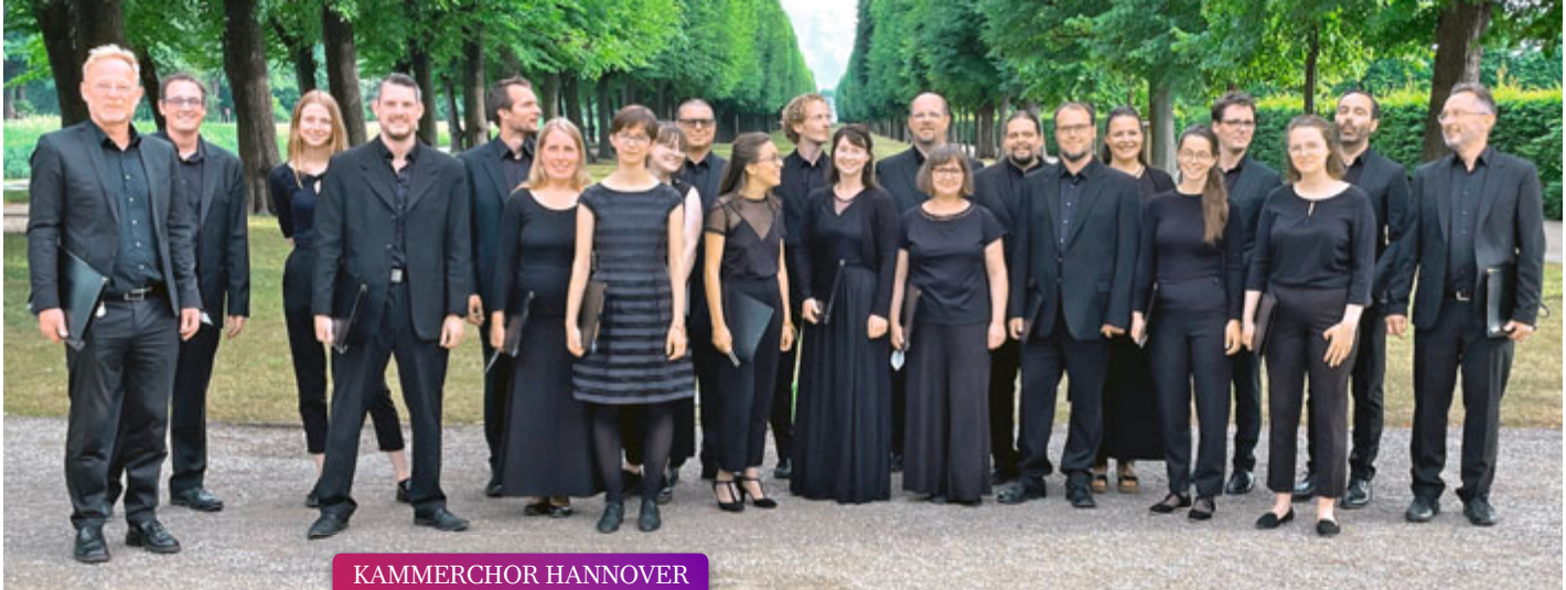
KAMMERCHOR HANNOVER Bach um Fünf // 04.12.