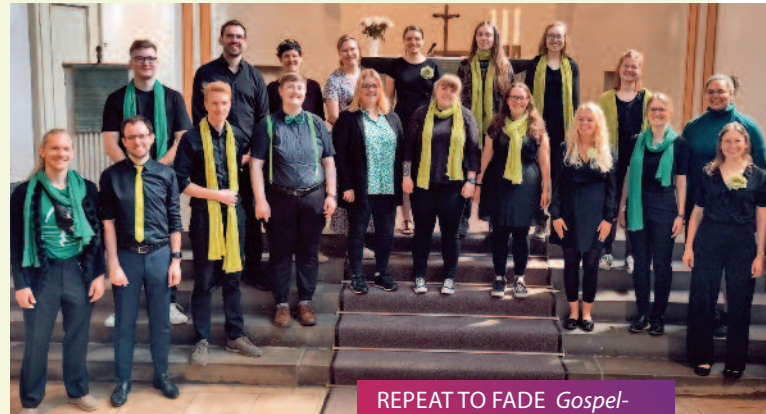
REPEAT TO FADE Gospel- Gottesdienst Classic // 19.11.