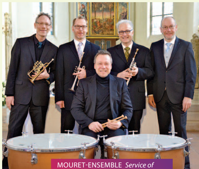
MOURET-ENSEMBLE Service of the Nine Lessons and Carols // 14.12.