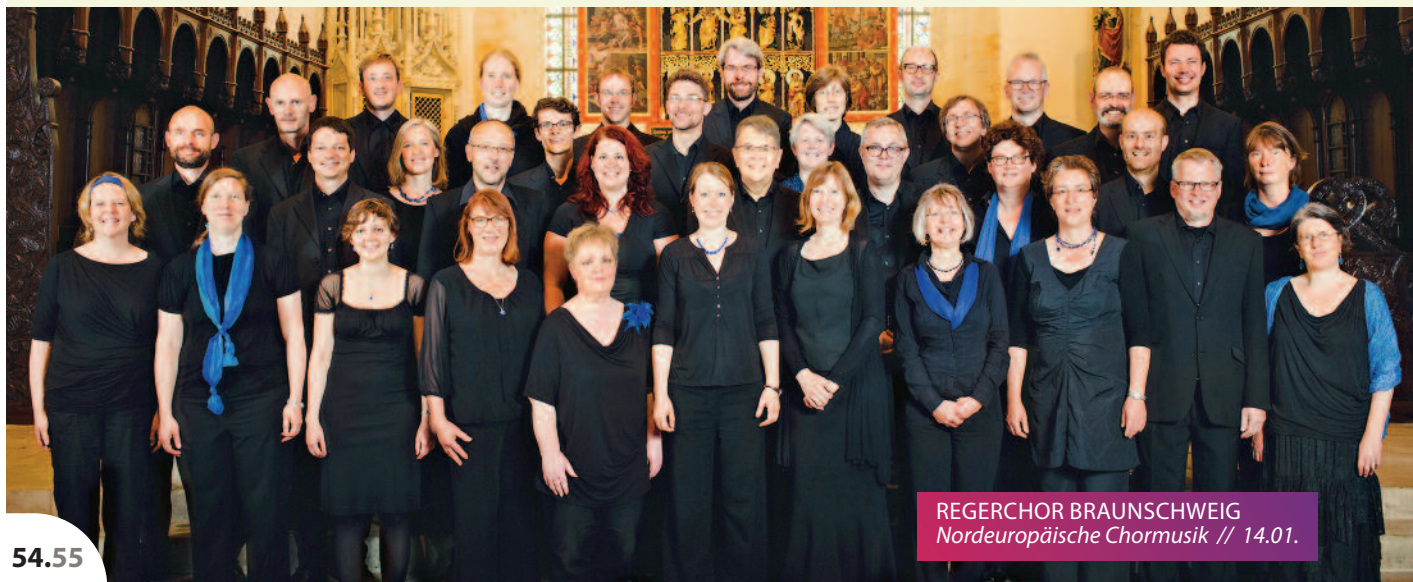
REGERCHOR BRAUNSCHWEIG Nordeuropäische Chormusik // 14.01.