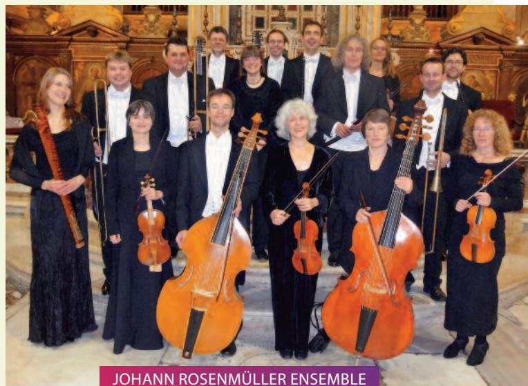
JOHANN ROSENMÜLLER ENSEMBLE Schütz: Weihnachtshistorie // 28.01.