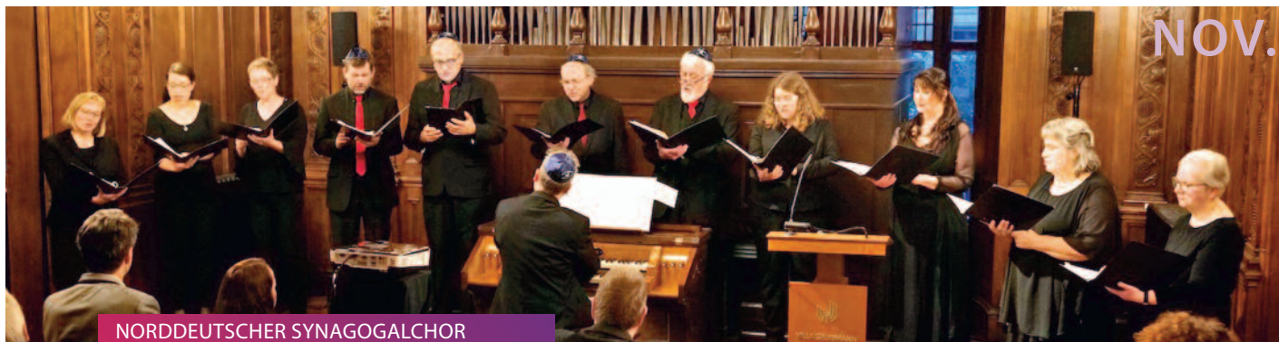
NORDDDEUTSCHER SYNAGOGALCHOR Evangelische Messe zur Friedensdekade // 12.11.