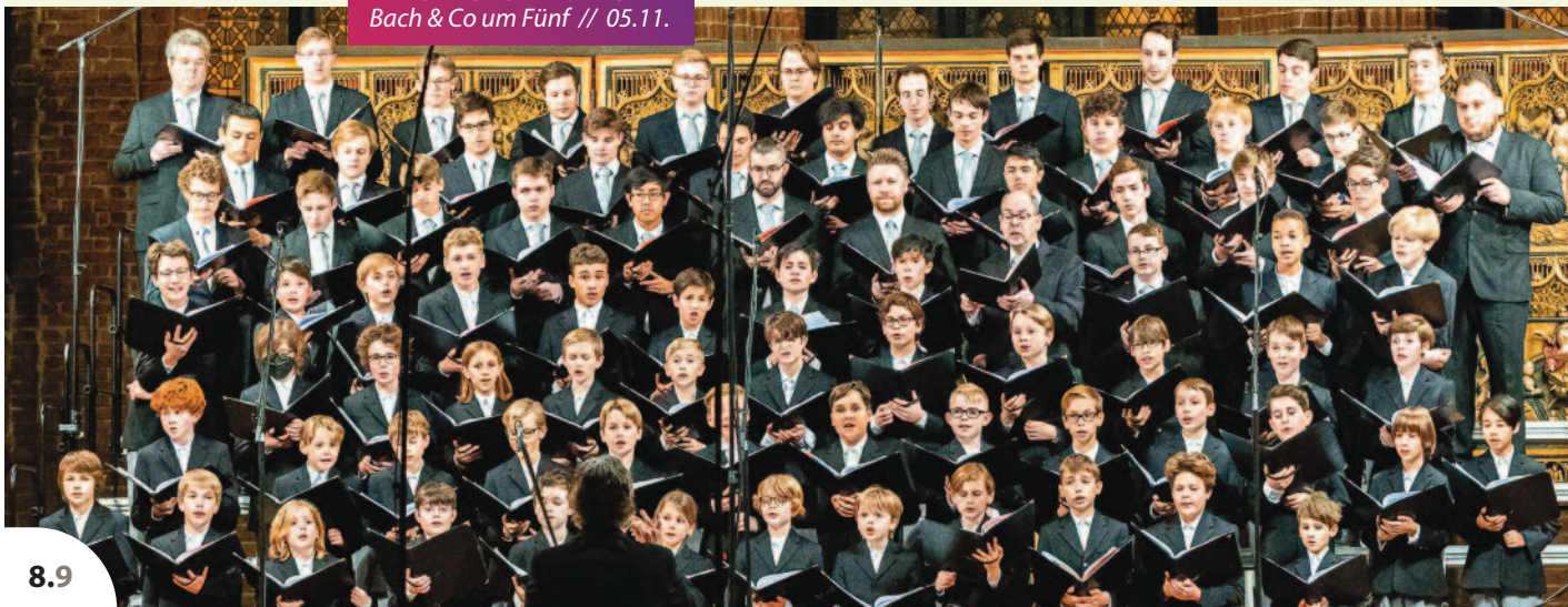
KNABENCHOR HANNOVER Bach & Co um Fünf // 05.11.