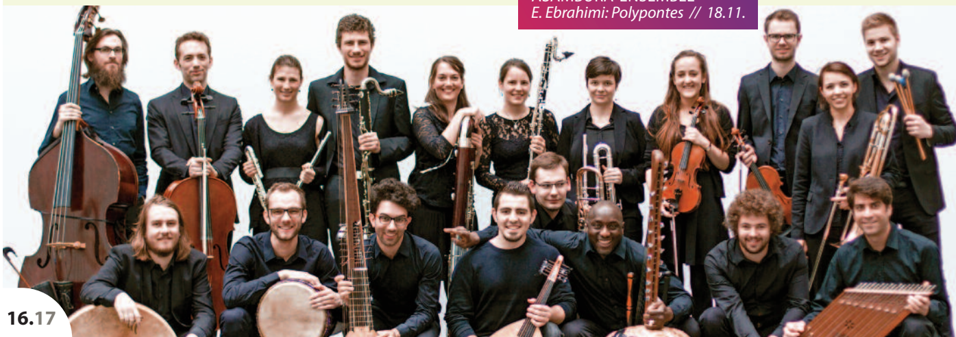
ASAMBURA-ENSEMBLE E. Ebrahimi: PolyPontes // 18.11.