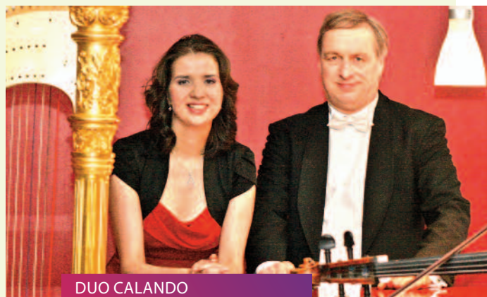
DUO CALANDO Kostbarkeiten der Musik // 12.11.