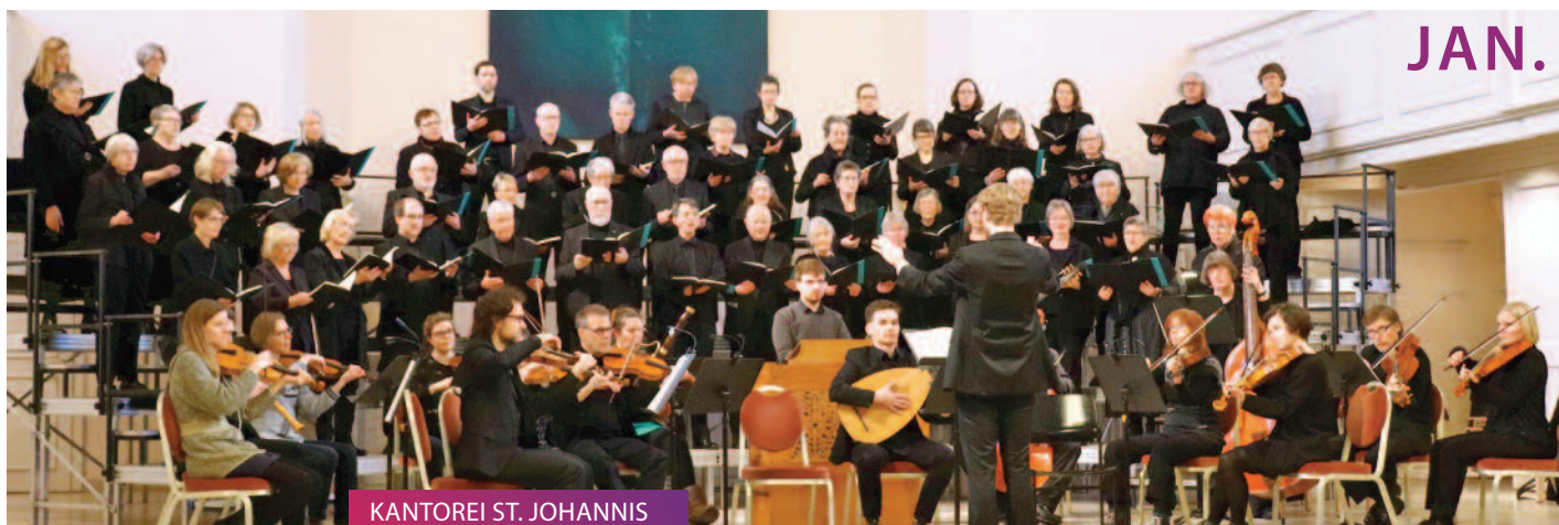
KANTOREI ST. JOHANNIS Bach & Co um Fünf // 07.01.