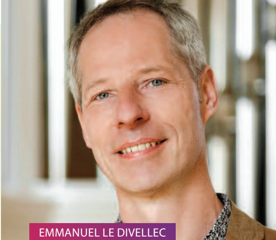
EMMANUEL LE DIVELLEC Orgelkonzert // 18.11.