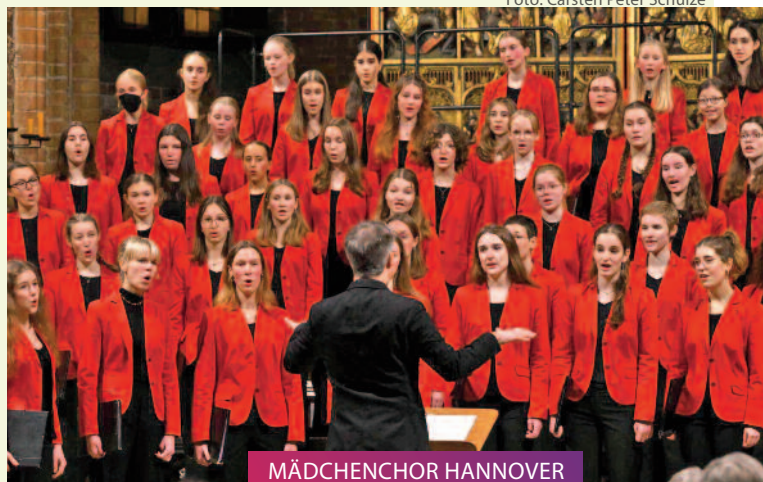
MÄDCHENCHOR HANNOVER Weihnachtskonzert // 16.12.