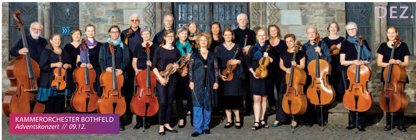
KAMMERORCHESTER BOTHFELD Adventskonzert // 09.12.