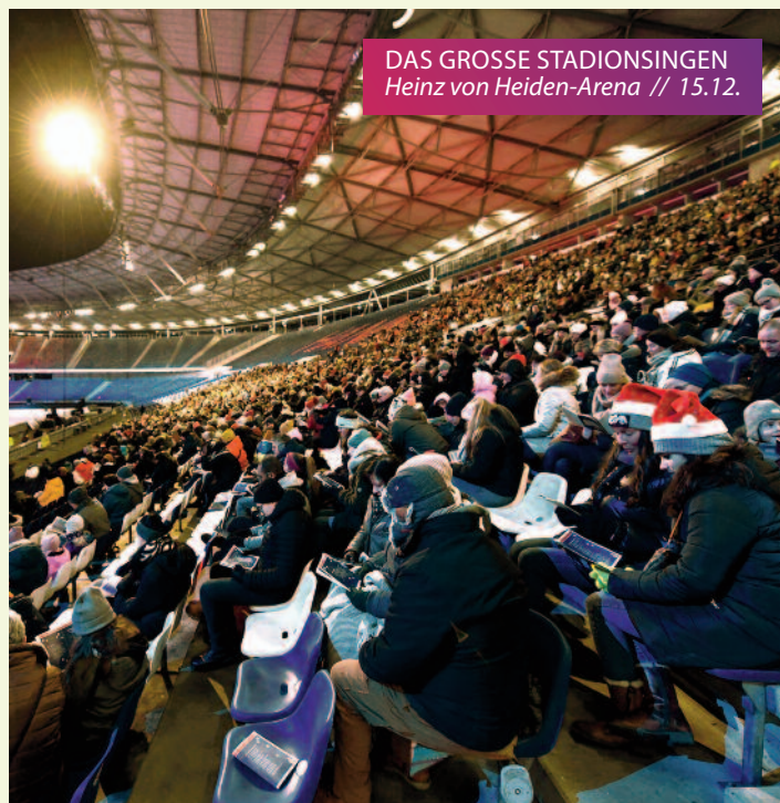
DAS GROSSE STADIONSINGEN Heinz von Heiden-Arena // 15.12.