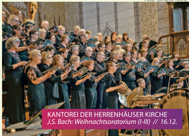
KANTOREI DER HERRENHÄUSER KIRCHE J.S. Bach: Weihnachtsoratorium (I-III) // 16.12.