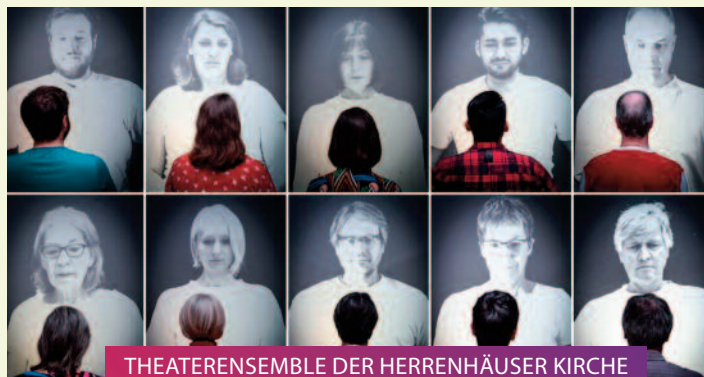
THEATERENSEMBLE DER HERRENHÄUSER KIRCHE Innenansichten – To be or not to be // 10.11.