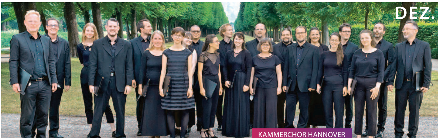
KAMMERCHOR HANNOVER Weihnachtskonzert // 10.12.