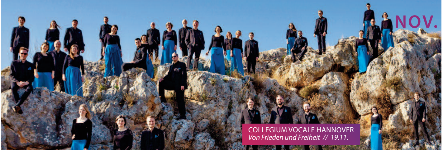
COLLEGIUM VOCALE HANNOVER Von Frieden und Freiheit // 19.11.