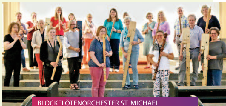
BLOCKFLÖTENORCHESTER ST. MICHAEL Musikalischer Festgottesdienst zum 1. Advent // 03.12.