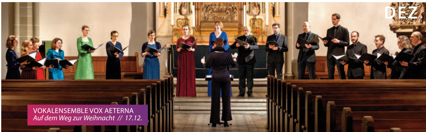
VOKALENSEMBLE VOX AETERNA Auf dem Weg zur Weihnacht // 17.12.