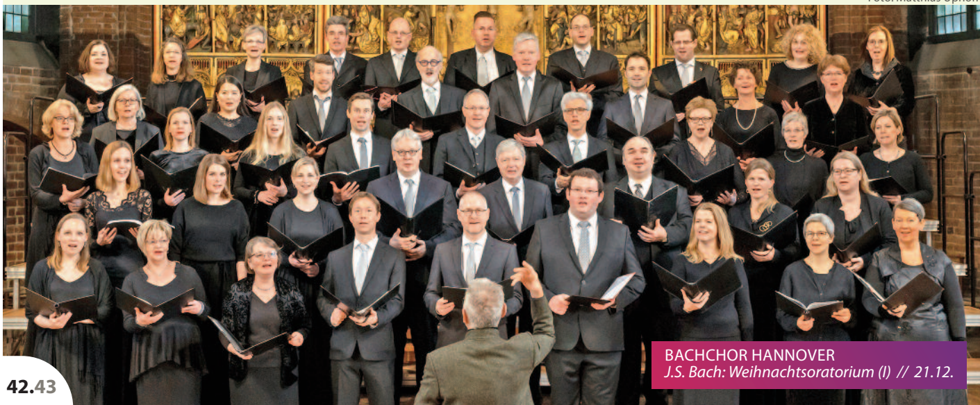
BACHCHOR HANNOVER J.S. Bach: Weihnachtsoratorium (I) // 21.12.