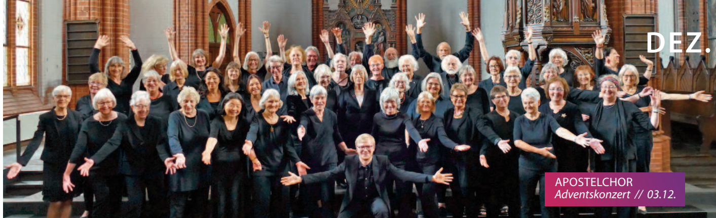
APOSTELCHOR Adventskonzert // 03.12.