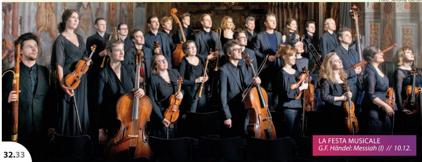
LA FESTA MUSICALE G.F. Händel: Messiah (I) // 10.12.