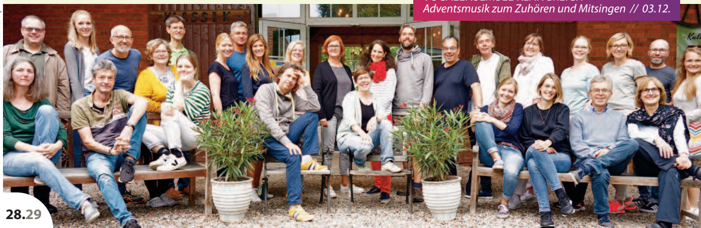
VOCALENSEMBLE KLANGREICH Adventsmusik zum Zuhören und Mitsingen // 03.12.