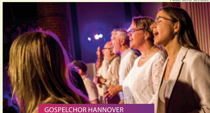
GOSPELCHOR HANNOVER Gospel-Gottesdienst Classic // 17.12.